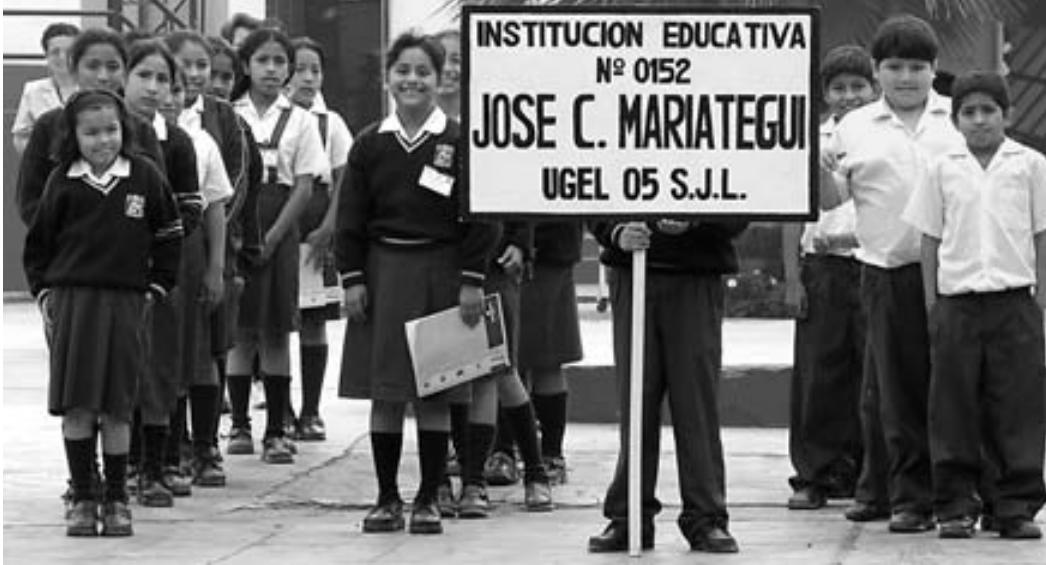
Formation stricte et bien péruvienne des vigies scolaires du collège J.C. Mariategui lors de la remise du diplôme d'honneur.

n'est pas un espace facultatif où les parents peuvent «faire manquer quand ils le veulent» leurs enfants.